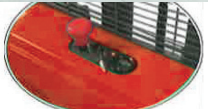
Emniyet / Emergency stop