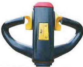
Standar kol / Standard Handle