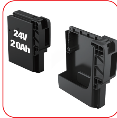
Li-ION AKÜ & AKÜ YERİ