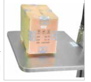
Opsiyon B5: Platform üzeri paslanmaz çelik tabla