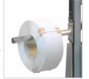
Opsiyon A2: Paslanmaz rulo aparatı