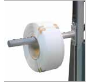
Opsiyon A3: Konveyörlü rulo aparatı