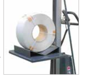
Opsiyon B2: V şekilli tabla