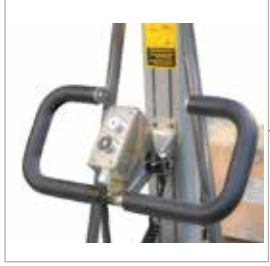
Platformu çekme ve itmeye yarayan yönlendirme kolu