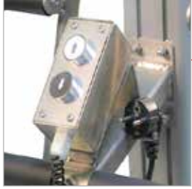
Akülü indirme ve kaldırma için kablolu kumanda ve dahili şarj kablosu