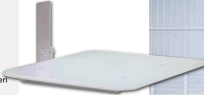
Genişlik: 600mm Uzunluk: 470mm

/// Ürün üzerinde standart olarak polietilen taşıma platformu bulunmaktadır. Aksesuarlar sayfasından ihtiyacınıza cevap verecek aksesuar seçimi yapabilirsiniz. ///