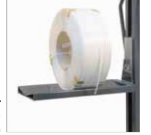
Opsiyon B1: V şekilli platform