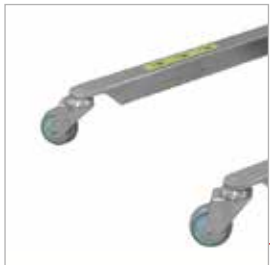
360° dönebilen ön tekerlekler