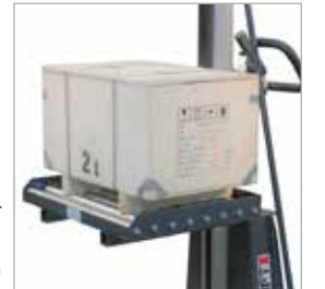
Opsiyon B6: Konveyörlü platform