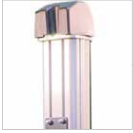
Hafif ve kullanışlı alüminyum mast