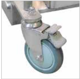
270° dönüş açısına sahip ve kilit mekanizmalı arka tekerlekler