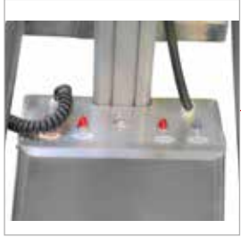
Açma/kapama ve ikaz paneli