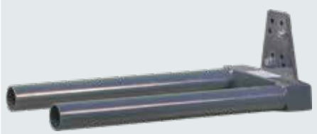
A4 Çift Rulo Aparatı Çap: 50mm İçten içe çatal genişliği: 152mm Dıştan dışa çatal genişliği: 250mm Çatal uzunluğu: 250mm