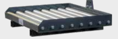
B6: Konveyörlü Platform İç genişlik: 590mm Uzunluk: 465mm Silindir sayısı: 8