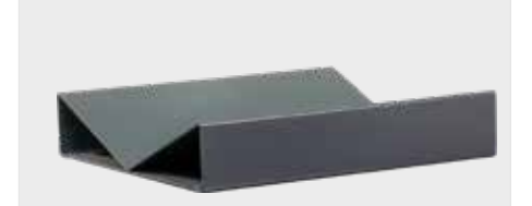
B2: V Şekilli Tabla PE Platform üzerinde kullanılır. Genişlik: 400mm Uzunluk: 400mm Yükseklik: 80mm