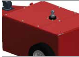
Hidrolik kaplin - ön XXL