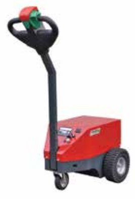
LX-M1.8 AKÜLÜ ÇEKİCİ İTME VE ÇEKME KUVVETİ 1.800kg Art. No: 5700 00 03