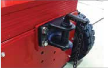
Rockinger RO230B35000 pin 35mm