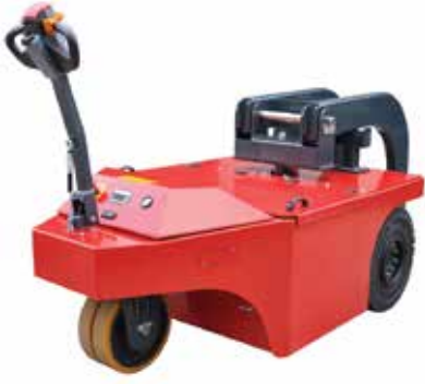
LX-4XL AKÜLÜ ÇEKİCİ İTME VE ÇEKME KUVVETİ 40.000kg Art. No: 5700 00 13