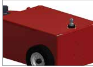
Hidrolik kaplin - arka XXL