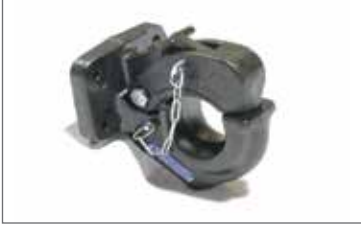
Rockinger RO231A11000 STK NATO