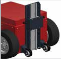
Yüksekliği ayarlanabilir braket 600mm XL Yüksekliği ayarlanabilir braket 800mm XL Yüksekliği ayarlanabilir braket 800mm XXL