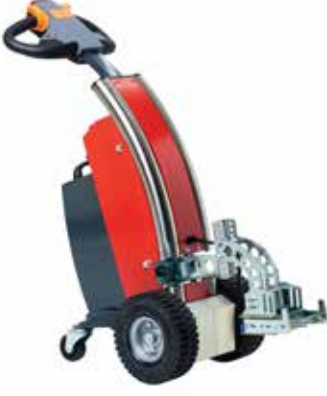
LX-S AKÜLÜ ÇEKİCİ İTME VE ÇEKME KUVVETİ 1.300kg Art. No: 5700 00 01