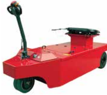
LX-20T RÖMORK ÇEKİCİSİ İTME VE ÇEKME KUVVETİ 20.000kg Art. No: 5700 00 19

Ürün üzerinde değiştirilebilir akü, harici şarj cihazı ve standart bağlantı kaplin yer alır.