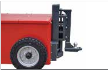
Hidrolik dikey kaplin 200mm XXL