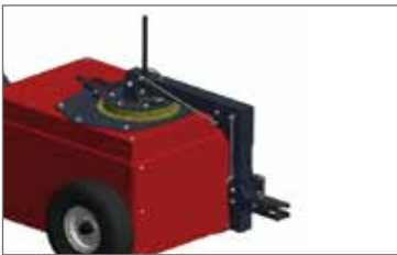
5. Teker kaplin XXL