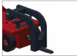
Hidrolik 5. teker kaplin 4XL