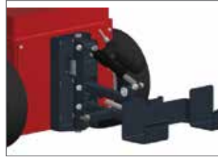
S&B Kendinden kitlemeli kaplin