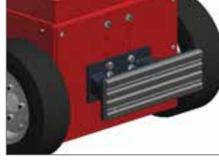
İtme barı 400x130mm L, XL,XL+,XXL İtme barı 760x195mm L, XL,XL+,XXL