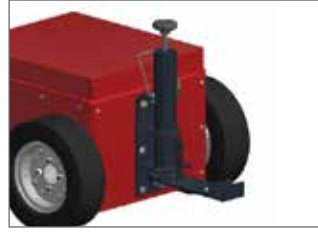
Yaylı kaplin M,L, XL,XL+