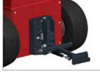
S&B Amortisörlü kaplin M,L, XL,XL+