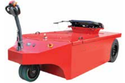
LX-40T RÖMORK ÇEKİCİSİ İTME VE ÇEKME KUVVETİ 40.000kg Art. No: 5700 00 20

Ürün üzerinde değiştirilebilir akü, harici şarj cihazı ve standart bağlantı kaplin yer alır.