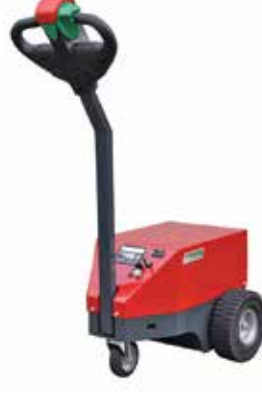
LX-M1.5 AKÜLÜ ÇEKİCİ İTME VE ÇEKME KUVVETİ 1.500kg Art. No: 5700 00 02