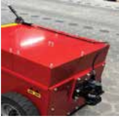
Rockinger kaplin Kompakt RO245A45500 Handhevel Rockinger RO245 Kablo L=1250mm Kablo L=2000mm Kablo L=2500mm