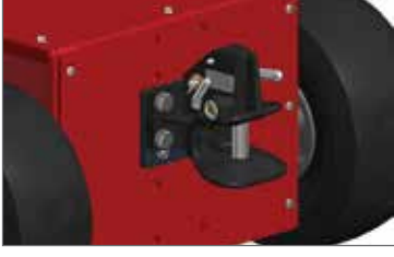
M,L,XL,XL+, XXL Rockinger R0244A35002 25mm pim Rockinger RO244L35002 25mm pin ayak kilitlemeli Montaj adaptörü